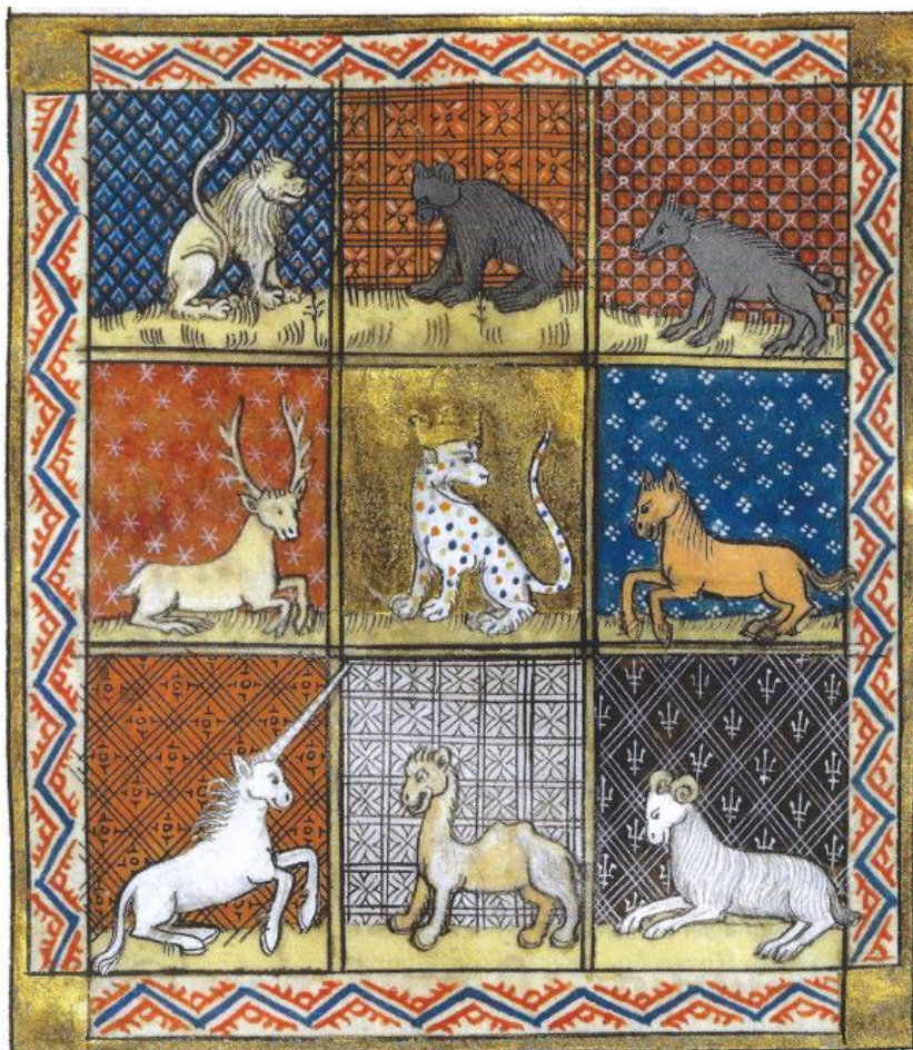
Miniature du Livre des propriétés des choses, de Barthélémy l'Anglais, XIII e siècle.

C'est au Moyen-âge qu'est inventé un nouveau genre de livre : les bestiaires, Il s'agit de catalogues d'animaux, réels ou imaginaires. Pour chaque animal, on trouve une description et une interprétation symbolique en vue d'un enseignement religieux ou moral.